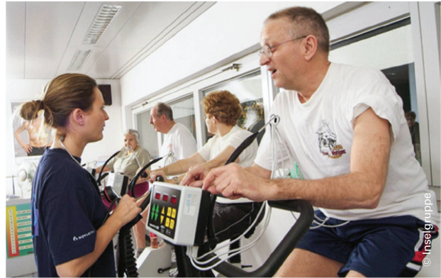
Veloergometer: Individuelle Betreuung auch in der Gruppe. | Vélo ergomètre: un accompagnement individuel aussi en groupe.