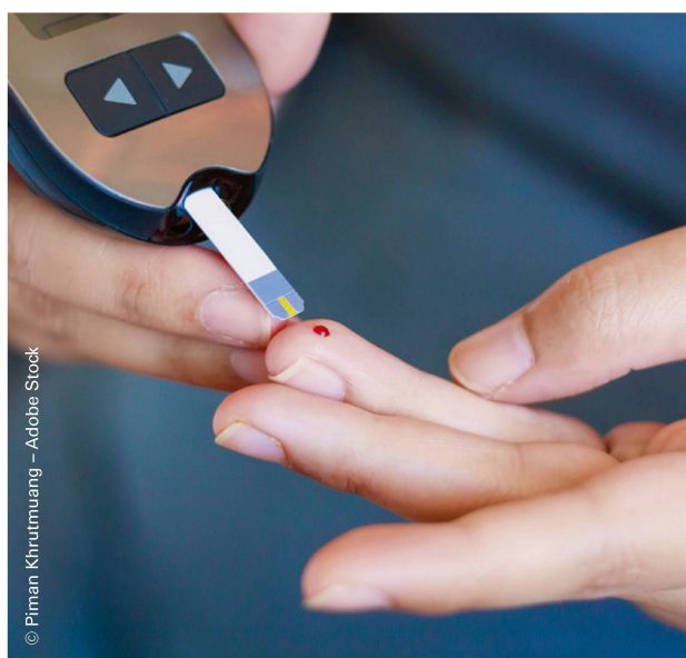
Diabetes ist eine von 31 Komorbiditäten von Adipositas. | Le diabète est l'une des 31 comorbidités de l'obésité.

Ist das Übergewicht einmal da, so stellt sich die Frage nach einer Behandlung. Ein Grossteil der Patienten machen spontan eine Diät, wie sie im Handel oder in Zeitschriften angepriesen werden. Solche Diäten sind auf Dauer schwierig durchzuhalten, und wiederholte Rückfälle bewirken einen Jo-Jo-Effekt. Ein ständiges Versagensgefühl stellt sich ein, das sich negativ auf das Selbstvertrauen auswirkt.