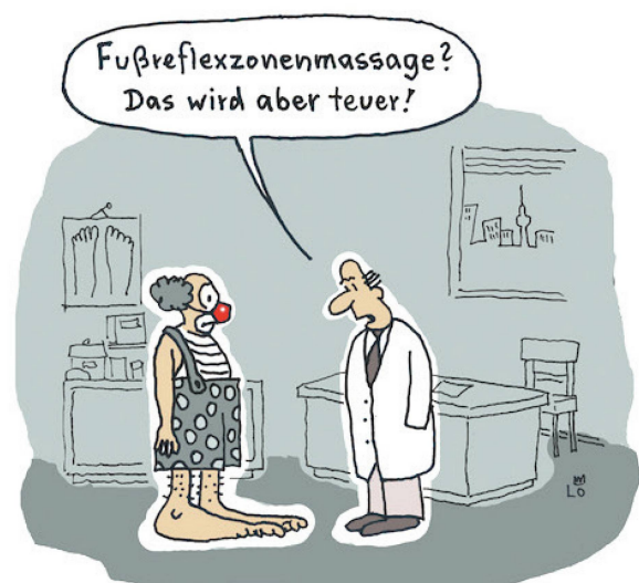
«Un massage des zones réflexes du pied? Ça vous coûtera cher!»

L'humour permet de ne pas se laisser envahir par les peurs et l'insécurité mais de prendre une distance utile et de reprendre davantage une position d'acteur. Le psychologue Viktor Frankl l'a décrit de manière fort impressionnante dans le récit de ses expériences dans le camp de concentration. Là-bas, lui et un codétenu décidèrent de se raconter une histoire drôle par jour, l'humour étant quelque chose qui ne pouvait pas leur être enlevé, même dans un camp de concentration [10]: «L'humour est aussi une arme de l'âme dans sa lutte pour son auto-préservation. Il est bien connu que l'humour, comme pratiquement rien d'autre dans l'existence humaine, est capable de créer de la distance et de se placer au-dessus de la situation, ne serait-ce que, comme nous l'avons dit, pour quelques secondes à peine.»