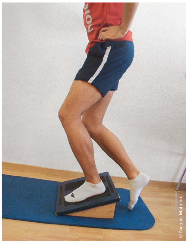
Abbildung 4: Einbeiniger Squat auf schiefer Ebene (Knie hinter Zehen). Illustration 4: Fente avant sur plan incliné (genou derrière orteils).

Beim einbeinigen Squat auf schiefer Ebene mit Ausfallschritt nach vorne sind die Belastung der Patellasehne, die Kraft des M. quadriceps, das maximale Drehmoment des Knies und der Flexionswinkel des Knies höher, wenn sich das Knie über die Zehen hinausbewegt (A) ( Abbildung 3 ). Dies wiesen Zellmer et al. (2019) nach [13]. Die Belastung beim Schritt ist geringer, wenn das Knie hinter den Zehen bleibt (B) ( Abbildung 4 ). Folglich wird die Patellasehne bei Übung A mehr belastet als bei Übung B.