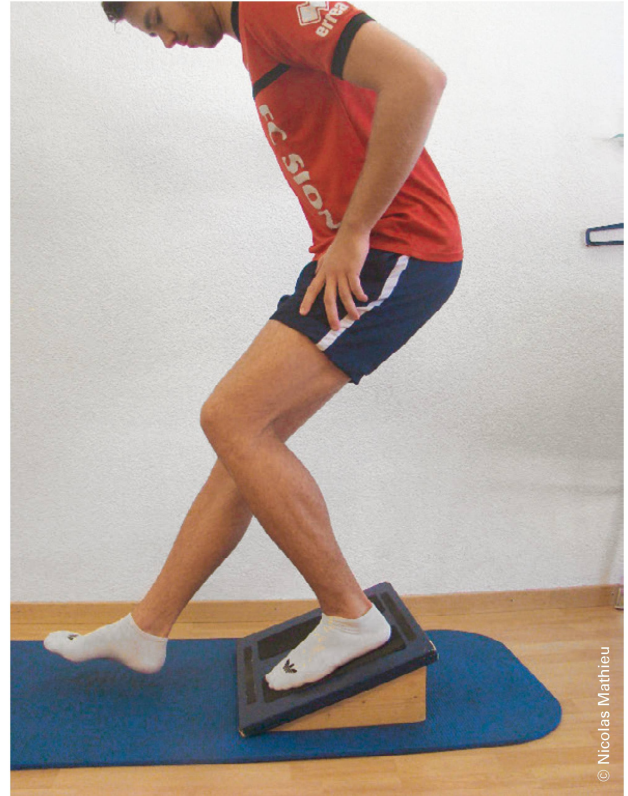
Abbildung 3: Einbeiniger Squat auf schiefer Ebene (Knie vor Zehen). Illustration 3: Fente avant sur plan incliné (genou devant orteils).

ten mit einem isokinetischen Dynamometer gemessen. Dabei ermöglicht es unkompliziert präzise und reproduzierbare Kraftmessungen (Abbildung 2) [10].