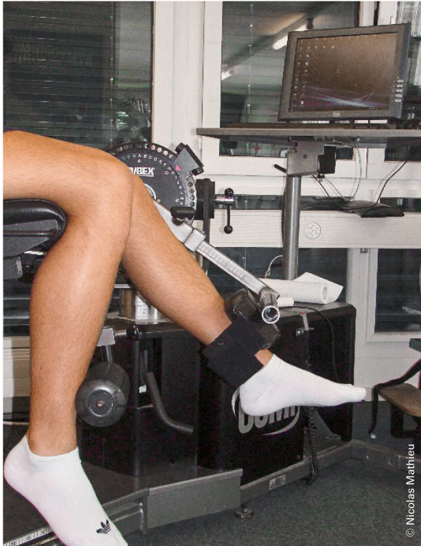
Abbildung 2: Isokinetischer Krafttest. | Illustration 2: Test isocinétique.