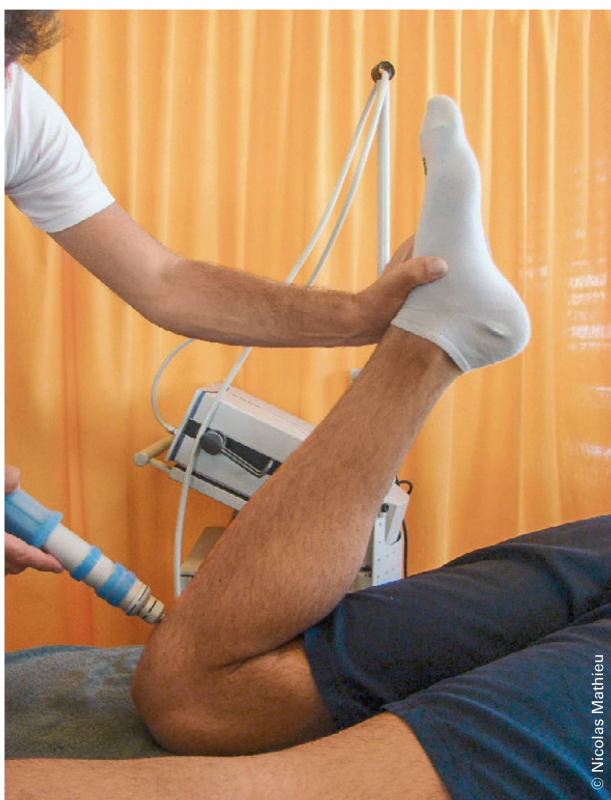
Abbildung 5: Extrakorporale Stosswellentherapie. I Illustration 5: Traitement par ondes de choc extracorporelles.

Wenn die initiale Behandlung nicht wirkt, suchen Physiotherapeuten und andere Gesundheitsfachkräfte sowie Patienten häufig nach Behandlungsalternativen. Weitere eingesetzte Methoden sind wie erwähnt insbesondere Querfraktionen