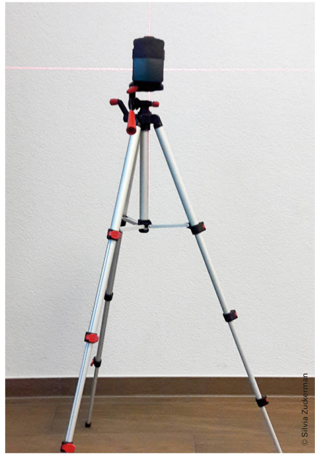
Abbildung 2: Crossline-Laser auf Stativ. | Illustration 2: Laser à lignes croisées sur trépied.

Frühere Forschungsversuche haben uns sensibilisiert, dass das Auge Distanzabweichungen am Körper falsch interpretieren kann. Deshalb haben wir einen günstigen, einfach handhabbaren Crossline Laser ( Abbildung 2 ) zu Hilfe genommen,