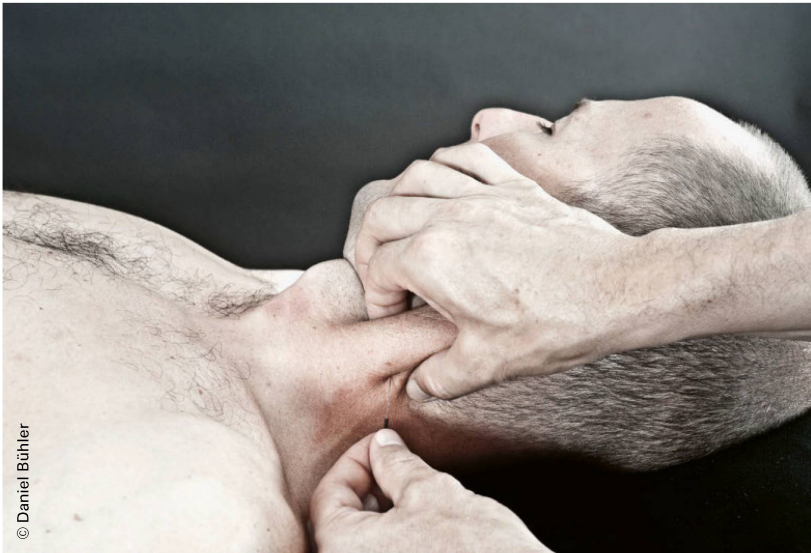
Abbildung 3: Dry-Needling-Behandlung des Musculus Sternocleidomastoideus. | Figure 3: Traitement de dry needling du muscle sterno-cléido-mastoïdien.

En cas de douleurs au niveau des cervicales, de la tête et de l'articulation temporo-mandibulaire, l'ensemble des muscles des épaules, de la nuque et de la mâchoire doit être examiné et traité. Tous les muscles traités par thérapie manuelle des points gâchettes ne peuvent pas être traités par dry needling en raison de leur anatomie ou de leur localisation. En cas de douleurs cervicales locales, les muscles les plus souvent traités par dry needling sont les