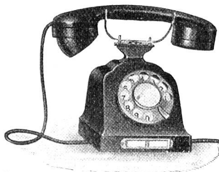
Automatischer Telephon- apparat „Hasler“ · Modell 1930

INHALT: Erlebnisse aus der Funker-R. S. 1932 + Vereinigung Schweizerischer Feldtelegraphenoffiziere: Das Schiedsrichternetz in den Manövern der 6. Division 1932 (Schluss) + Sektionsmitteilungen: Basel, Bern, Gotthard, Schaffhausen, Winterthur und Zürich + Sportliches.