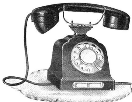
Automatischer Telephon- apparat, Hasler' · Modell 1930

Am Sonntag, dem 10. September 1933, in Bern