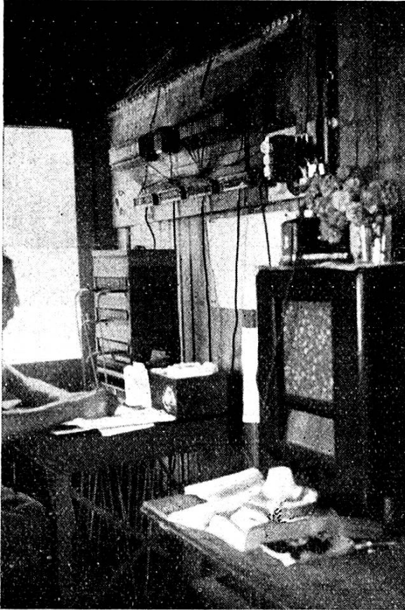
Tischzentrale am Schweiz. Pfadfinder-Bundeslager