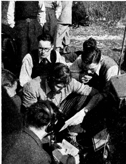
Zensur-Nr. VI 12474 SN

Um 1337 endlich kommt von «Benzin» die erste Meldung, die das Passieren von drei Patr. verzeichnet. Kurz darauf spricht auch «Musikant» von einer Spitzengruppe. Und Minuten nachher folgt Telegramm auf Telegramm! Wie Sie aus dem Programmheft ersehen, laufen auf der fast genau gleichen Piste Of.- und Uof.-Patr. gegeneinander. Der äusserst rege Verkehr rührt also