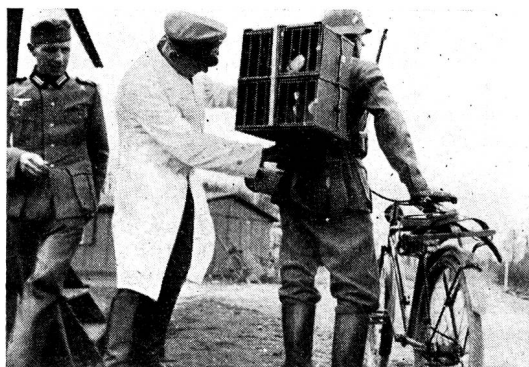
Deutscher Briefftauben-Träger vor der Abfahrt