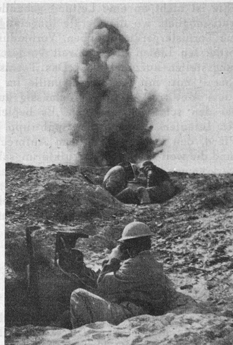
Kgl.-englisches Korps der Uebermittlungstruppen.

b) Fernschreiber . Die Fernschreibgeräte, die auf der Empfangs-, wie auf der Sendeseite Druckschrift liefern, haben die Telegraphie, die durch den Fernsprechverkehr stark zurückgedrängt worden war, zu neuer Bedeutung gebracht. Sie eignen sich ganz besonders für die Uebermittlung von längeren Meldungen und Befehlen und auch für die Führung von «Fernschreibgesprächen», wo auf