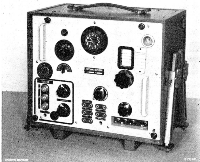
Abb. 1. Tragbares Richtstrahlgerät für sehr kurze Wellen.

Grundsätzlich ist festgestellt worden, dass eine Dezi-