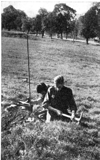
Bild 1. Bereits vorhandene Deckung ausnützend, wird fleissig weitergearbeitet. Auf dem Erdwall liegt der griffbereite Spaten; Funkerpioniere im wahrsten Sinn des Wortes.

Die Sta. Meystre hatte ihren Standort in einer natürlichen Senke, einige Meter innerhalb dem Waldrand, recht gut ge-