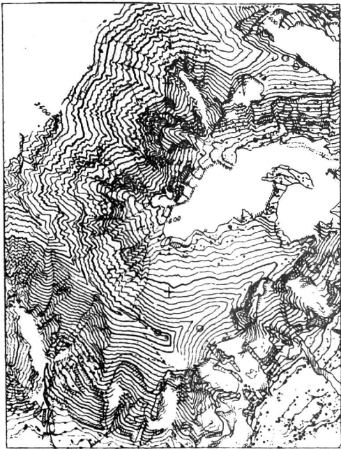
Ergebnis der photographischen Auswertung (Ferrocyan-Messtischblatt)