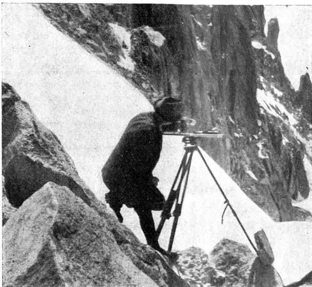
Im Gelände aufgestellter Meßtisch mit Topograph. Levé dans le terrain.

blatt und verändert das natürliche Bild zur kartographischen Darstellung. Bei dieser Arbeit kann der Topograph nicht ständig an einem festen Arbeitsplatz verweilen, sondern die Umstände zwingen ihn, das Gelände eingehend zu begehen. Die Wege sind abzuschreiten und nach ihrer Anlage und ihrem Zustand zu klassifizieren, damit sie in der entsprechenden Signatur in die Karte aufgenommen werden können. Spezielle Mühe erfordert oft die Aufnahme der Gemeindegrenzen, deren Verlauf in vielen Fällen erst während der topographischen Aufnahme abgeklärt werden muß und erst dann genau auf das Blatt übertragen werden kann. Bei dieser topographischen Beurteilung des Geländes werden aber nicht immer alle Einzelheiten aufgenommen, sondern vielfach sind Details zusammenzufassen und zu vereinfachen; beispielsweise geschlossene Ortschaften nur charakteristisch und mit den wichtigsten Durchgangsstraßen darzustellen. Diese Feldredaktion schafft schon eine Klärung der Kartenelemente nach ihrer Wichtigkeit, wie sie im Gelände in Erscheinung treten. Gleichzeitig gilt es, bestimmte Geländepunkte und Häusergruppen in bezug auf ihre Benennung abzuklären. Diese Aufgabe ist manchmal nicht leicht, da Ortsnamen, und vor allem ihre Schreibart, im Laufe der Jahre sich verändern können oder sich gar ganz gewandelt haben.