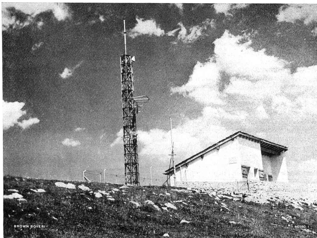
Unbediente Relaisstation auf dem Chasseral

für die drahtlose Telephonverbindung mit der Endstation Genf und der Relaisstation Uetliberg.