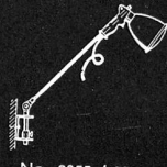
No. 9055 / 9050