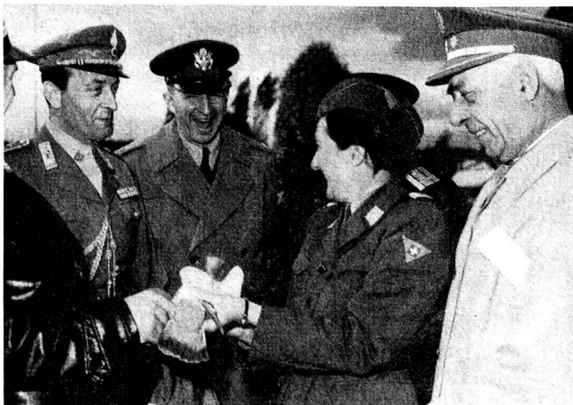
Die ausländischen Militärattachés im Gespräch mit einer FHD des Brieftaubendienstes