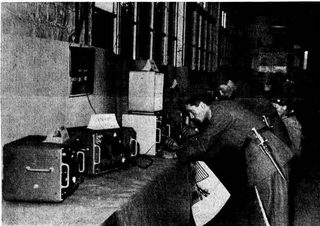
Interessierte Besucher in der Geräteschau