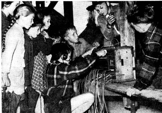
Eifrige Jungmannschaft auf dem «Robinsonplatz»