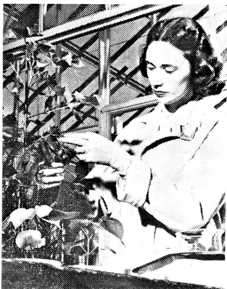
Die Nebenprodukte der Atomkraftherzeugung dienen mannigfaltigen wissenschaftlichen Forschungszwecken. Hier wird die Wirkung eines mit radioaktivem Phosphor durchsetzten Düngemittels auf Kulturpflanzen ermittelt.

nicht zu reden von den vielen tausend auswärtigen Besuchern, die täglich in die Konferenzstadt strömten, um durch Anschauungsunterricht etwas über das moderne Wunder der Atomspaltung zu lernen.