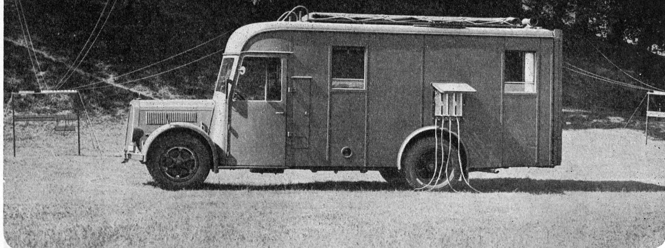
Einer der von uns projektierten und ausgerüsteten Zentralenwagen.