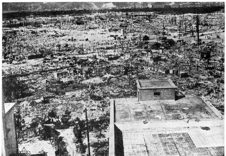
Betongebäude in 1,5 km Entfernung vom Schadenzentrum in Hiroshima. Bâtiment de béton situé à 1,5 km du centre de dévastation à Hiroshima