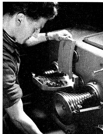
Das Verfeinern des Kupferdrahtes auf immer dünnere Drahtdurchmesser erfolgt in modernen Ziehmaschinen. Das Bild illustriert eine Feindrahtzieh-anlage, bei welcher der Kupferdraht durch kalibrierte Industriediamanten bis zu einem Drahtdurchmesser von 0,025 mm gezogen werden kann.

der meistverwendete Typ neben 14- und 28adrigen Kabeln enthielt sieben einadrige Leiter — veranlasste die Forscher, besonders seit der Einführung des Telephons, Kabel mit geringer Raumbeanspruchung herzustellen. Es gelangten in der Folge mit Harz, Wachs und Öl imprägnierte Faserstoffe (Jute, Hanf, Baumwolle, Papier) für die Aderisolierung der sogenannten Faserstoffkabel zur Verwendung, die sich, neben den um die Jahrhundertwende eingeführten Papierlufttraumkabeln, bis zum Ende des ersten Weltkrieges erhielten.