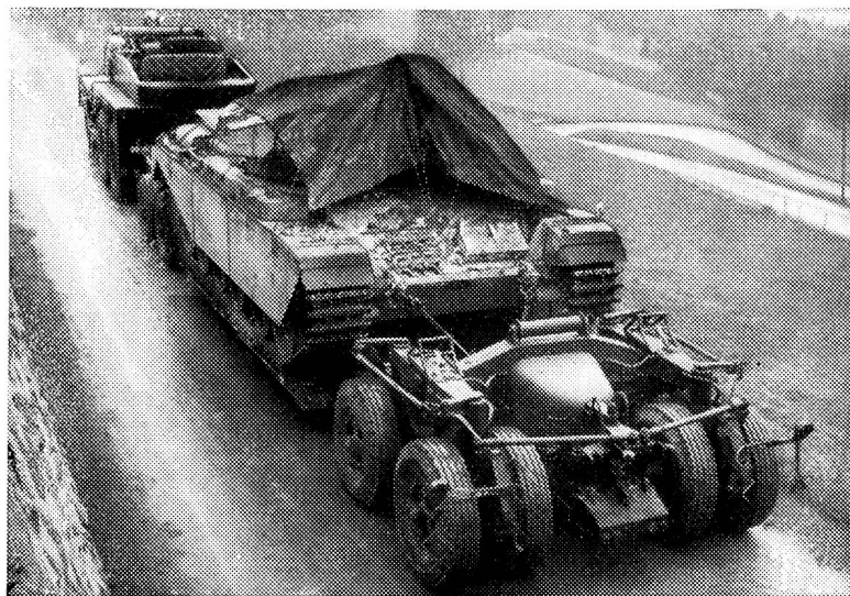
Aufnahme aus der Panzertruppe: schwerer Tank, verladen für den Strassentransport

Die festgesetzte Ausgabenbegrenzung erlaubt die Aufrechterhaltung der heutigen Zahl der Kampfflugzeuge auf die Dauer nicht mehr. Sie wird mit der Zeit absinken. Der Zeitpunkt eines wesentlichen Absinkens ist jedoch zu weit entfernt, als dass er uns heute schon beschäftigen müsste.