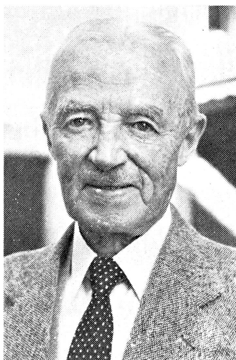
Bild des Privatmannes Henri Guisan aus seinen letzten Lebensjahren, aufgenommen im Garten seines Heimes am Genfersee.

In der Normandie entwickeln sich gewaltige Schlachten; die russischen Truppen versetzen den Deutschen Schlag auf Schlag. Die Alliierten landen in Südfrankreich und eröffnen eine weitere Front. Der Oberbefehlshaber unserer Armee steht wiederum vor schweren Entschlüssen; was werden die deutschen Armeen in ihrer Lage tun? Werden sie versuchen, durch unser Land durchzubrechen, um ihre wankenden Fronten zu stützen. In den letzten Augusttagen 1944 werden 3 Divisionen und 3 Leichte Brigaden aufgeboden. An-