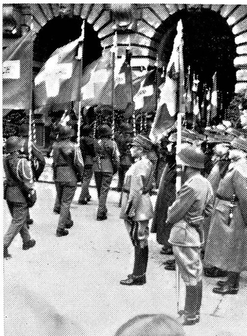
Links: Der General grüsst vor dem Bundeshaus die Feldzeichen der Armeeeinheiten anlässlich der Fahnenmehrung im Jahre 1945 in Bern zum Abschluss der Aktivdienstzeit.

«Ich habe Wert darauf gelegt, Euch an diesem historischen Ort, auf dem für unsere Unabhängigkeit symbolischen Boden, zu versammeln, um Euch über die Lage zu orientieren und mit Euch als Soldat zu Soldaten zu sprechen. Wir befinden uns an einem Wendepunkt unserer Geschichte. Es geht um die Existenz der Schweiz. Hier werden wir als Soldaten von 1940 aus den Lehren und dem Geist der Vergangenheit Kraft schöpfen, um Gegenwart und Zukunft des Landes entschlossen ins Auge zu fassen und um den