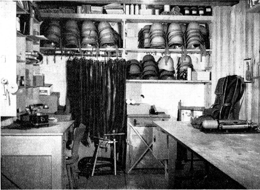
Kleider- und Materialmagazin des Zivilschutzes in Sursee