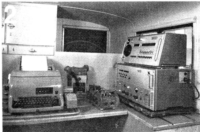
Zellweger AG., Uster/ZH Apparate- und Maschinenfabriken Uster