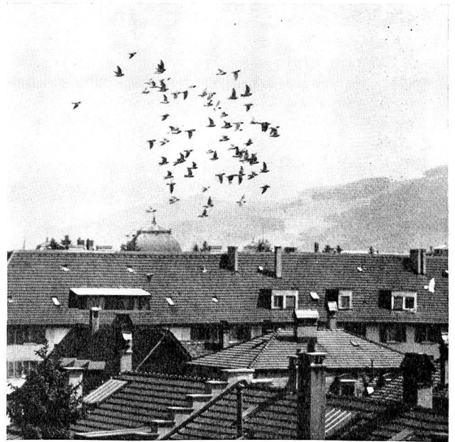
Die geschlossene Gesellschaft kreist über den Dächern der Bundesstadt. Brieftauben sind nicht zu verwechseln mit ihren Artgenossen, den Haus-, Strassen- oder Stadtauben.

Wiewohl solche Wettflüge aus Frankreich, Holland, Deutschland und Österreich dem Brieftaubensport die besondere Note aufdrücken, ist deren Wert doch nicht zu überschätzen. Viel wichtiger ist nämlich, dass die der Armee zur Verfügung zu stellenden Brieftauben in der näheren Umgebung und innerhalb der Landesgrenze bis zu Distanzen von mindestens 100 km auf Selbständigkeit trainiert werden. Denn wie aus vorstehenden Abschnitten hervorgeht, steht keineswegs fest, dass solche Langstreckenflieger im militärischen Einsatz zu zweit auch zuverlässig fliegen. Die Armee gewährt denn auch keinerlei Unterstützung für Auslandflüge. Aber auch innerhalb der Landesgrenze hat jeder Züchter die Möglichkeit, den Leistungsausweis zu erreichen, ohne am Geldspiel der Wettflüge teilnehmen zu müssen. Solche Tauben fliegen dann in der sogenannten Nullklasse oder in besonderen Kontrollflügen.