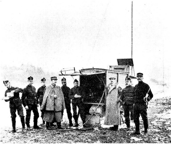
Abb. 7. Funkstation System Marconi.

Ebenfalls im Jahre 1905 wurde mit dem Erstellen der beiden festen Telefunken-Stationen mit 50 m hohen Antennenmasten auf Rigi-Scheidegg und Stöckli begonnen. Der Betrieb im Stationsgebäude konnte jedoch nicht sofort aufgenommen werden, weil die Gasmotoren, welche die Generatoren trieben, nicht einwandfrei funktionierten. Immerhin wurde in der Zeit vom 4. bis 21. Dezember 1905 eine Verbindung Rigi-Scheidegg—Stöckli hergestellt.