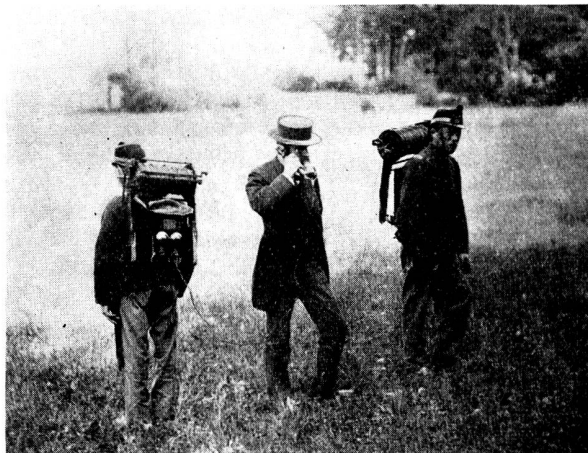
Abb. 4. Versuche mit einer der ersten Militär-Telephonstationen

Tatsächlich zeigt die folgende Abbildung 4 aus dem Genie- Wiederholungskurs in Plagne vom Jahre 1888, dass die Ver- wendung des Telephons in der Armee noch nicht allzulange erfolgt sein konnte.