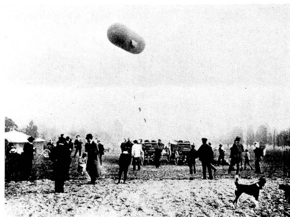
Abb. 6. Versuche mit der Ballonantenne in Thun im Jahre 1905.

«Schon im Jahre 1904 ist das Departement mit der Gesellschaft für drahtlose Telegraphie in Berlin, deren Fortschritte beständig verfolgt wurden, in Verbindung getreten. Die Unterhandlungen hatten das Resultat, dass im Laufe des Monats Dezember des Berichtsjahres Versuche mit tragbaren und fahrbaren Stationen dieser Art von einer vom Departement bezeichneten Kommission ausgeführt werden konnten. Dagegen war es nicht mehr möglich, solche Versuche auf feste Stationen auszudehnen, wohl aber sind deren zwei nahezu fertig eingerichtet, so dass im Frühjahr 1906 die Versuche auch mit diesen aufgenommen werden können, worauf unsererseits definitive Anträge für die Einführung drahtloser Telegraphie erfolgen werden.»