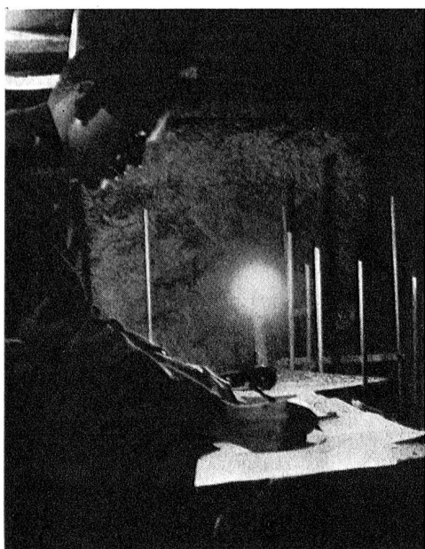
Ob wohl die brennende Kerze dazu benützt wurde, die Stromversorgung der SE-206 sicherzustellen?

Hier bloss ein kleines Detail: Der Rundspruch musste von einigen Stationen quittiert werden. Weil das bei verschiedenen wahrscheinlich nicht auf den ersten Anhieb gelang, musste die Zeit über das befohlene Funkverbot hinaus ausgedehnt werden. Drei Stationen haben nach dem befohlenen Funkverbot den Rundspruch erst quittiert, nachdem die Rundspruchstation sie dazu aufgefordert hat. Diese drei Stationen haben sich richtig verhalten. Die Phase Gelb bot an und für sich keine Schwierigkeiten.