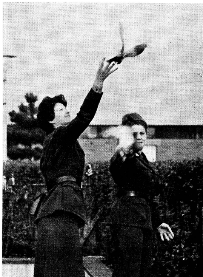
Auch die Brieftauben werden eingesetzt!