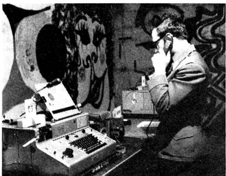
Der Präsident der Sektion Appenzell als Telephonordonnanz!

Das kantonale Musikfest von Samedan hat uns leider viele Pioniere weggeholt; sie mussten dort blasen, während wir das im trauten Funckerkreise auch taten. Aber zum Minimalbestand für eine KP 15 hat's bis zuletzt doch gereicht, denn vor Übungsbeginn erschienen doch noch einige unserer treuesten Kumpel. Um so mehr haben wir gearbeitet, vor lauter Eifer sogar an der Operation «Satellit» mitgefunkt — wir erhielten die Unterlagen nur als ZK —, und da es ja bei jedem Wettbewerb einen Schluss braucht, kamen wir wie gelegen (siehe Rangliste). Während in der ganzen Schweiz Regen platschte, kam bei uns so richtig weisser Schnee vom Himmel, zeitweise konnten wir sogar kleine Schneestürme beobachten. Einer davon hatte unsere Antenne derart mit statischen Aufladungen versorgt, dass wir uns für eine Zeit aus dem Netze zurückziehen mussten. Dann ist der Sender ausgestiegen, was aber offenbar nicht nur bei uns vorkam. Mit viel Finger-spitzengefühl und Fachkenntnissen konnte