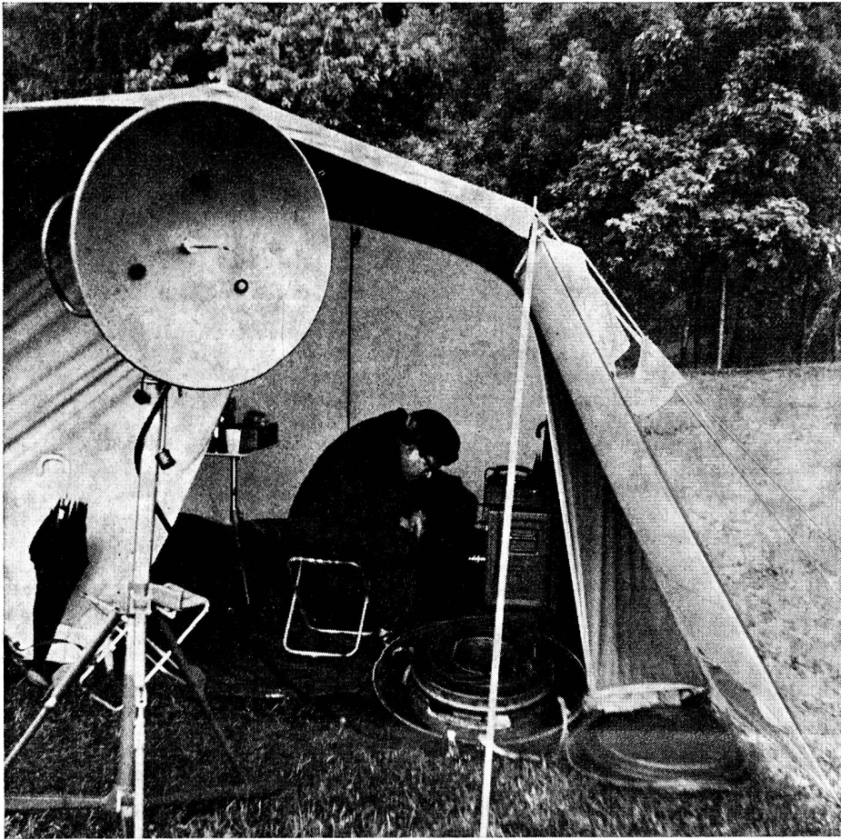
Die drei Schnappschüsse auf dieser Seite stammen vom fachtechnischen Kurs R-902 der Sektion Zürichsee rechtes Ufer

melite-Elektrisch» erschienen) das Wasser aus einem Regensammler in die Küche pümpeln muss, doch gemessen am zynischen Kommentar der Kameraden wurde der Frass genossen. Es soll eine beachtliche Anzahl Käfer, Spinnen, halbe Daumen und Haare aller Färbungen in den Knöpfli gewesen sein, wenn man den Kommentaren glauben darf. Der laue Sommerabend mit Mondschein lockte männlich (und weiblich) vors Haus, und der gemütliche Abend fand samt Umtrunk im Freien statt. Am Morgen gab's Kaffee, Milch, Käse, Butter und Confi mit Brot, und während nun die Kameraden funkgesteuert zu Fuss laufend neue Standorte zu suchen, zu beschreiben und Notizen zu machen hatten, zur grossen Freude eines Grenzwächters ohne Grenzverletzung mit den damit verbundenen Schwierigkeiten zwischen Bonn und Bern, präparierte das Küchenbullen-team, der Hitze wegen in der Badehose, einen währschaften Spatz und Tee citron, der einen rechten Sprutz 80 %-Rum enthielt, sehr zur Freude der bald darauf eintreffenden etwas abgekämpften Wanderkollegen, sprich Funkpatrouillen.