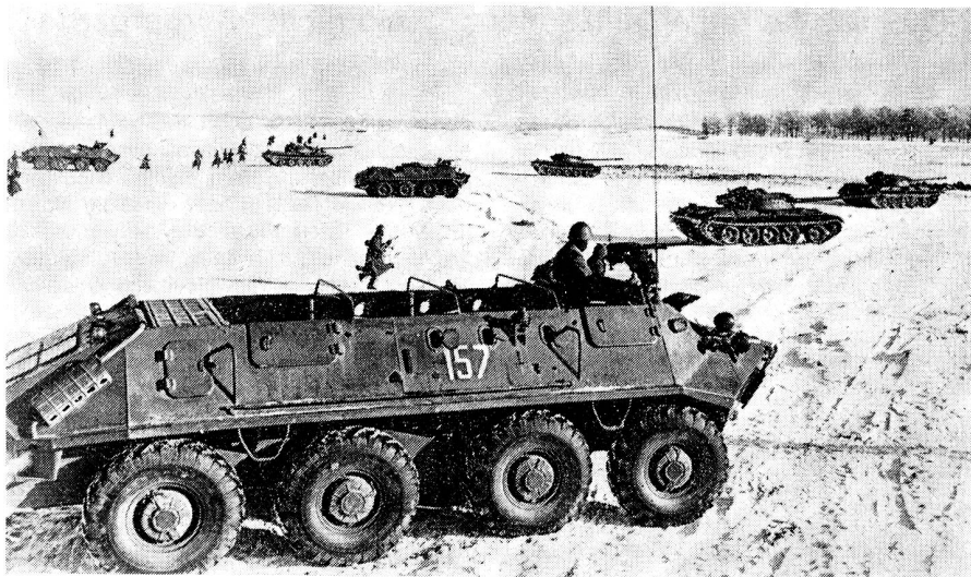
Chars et fantassins portés de l'armée soviétique lors de manœuvres

Ce dernier domaine revêt une importance particulière sur le plan de la dissuasion. En effet, l'Autriche et la Suisse constituent un corridor Est-Ouest d'une longueur de 800 km qui scinde en deux le dispositif de l'OTAN. Si la France cherchait, en cas de conflit en Europe, à se tenir à l'écart, l'OTAN se verrait contrainte pour assurer la liaison par la voie des airs entre ses secteurs Europe centre, où se trouve la masse de ses forces conventionnelles, et Europe sud, plus particulièrement l'Italie, de violer la neutralité de la Suisse ou de l'Autriche ou bien des deux pays. Cela ne manquerait pas d'appeler l'intervention des forces aériennes du Pacte de Varsovie qui pourraient aussi chercher à emprunter ce corridor pour prendre à revers les forces de l'OTAN. De telles manœuvres apparaissent d'autant plus vraisemblables que l'Autriche est incapable, vu l'état de sa défense aérienne, de s'y opposer. Il en résulte que la crédibilité de notre volonté de maintenir notre neutralité et de remplir les obligations qui en découlent, dépend dans une large mesure de l'efficacité de notre défense aérienne.