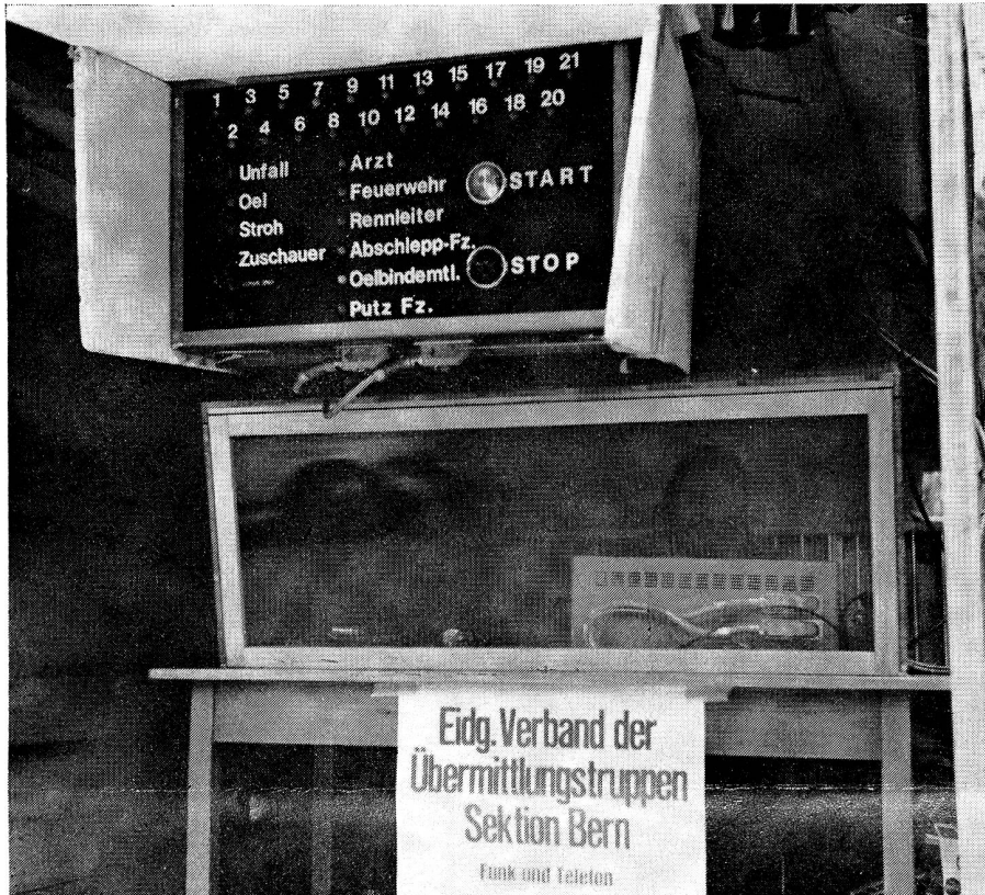
Dank einer neuartigen elektrischen Anzeigetafel am Start wird die Rennleitung und das übrige versammelte Rennkomitee innert weniger Sekunden über die Ursachen eines Startunterbruches orientiert. Konstruktion: Bruni/Herzog.