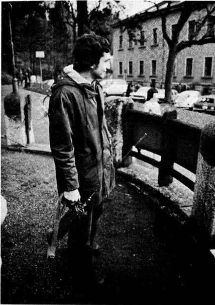
Sektion St. Gallen. Die Vorbereitungen sind getroffen. Geduldig wartete man auf Meldungen ...

Stationen die Verbindung herzustellen. Zwei «Langweiler» schalteten sich erst nach einigen Minuten ins Verbindungsnetz ein, weil sie bei der Befehlsausgabe den falschen Kanal notiert hatten ... Rund 1000 Wehrmänner starteten um 9.45 Uhr zum Wettkampf. Das hatte auch seine Folgen, denn nach kurzer Zeit wurden über Funk die ersten Läufer von den verschiedenen Stationen dem Start-Ziel-Posten bekanntgegeben. Als die ersten Läufer die Zielmarke überschritten, wollten alle Stationen die Sieger durch Funk ehren. Weil der Start-Ziel-Posten alle Hände voll zu tun hatte, wurde manch besserer Läufer mit einem schlechteren Platz verwechselt. Ein St. Galler Radiosprecher berichtete die Rangliste über Funk an alle Stationen. Nachdem der Schlussjeep die einzelnen Stationen passiert hatte, konnten sich die Funker aus dem Netz abmelden. Als wir die Funkgeräte zurückgaben, erhielten wir Funktionäre für die geleistete Arbeit einen Essbon, den wir natürlich sofort in der Militärkantine einlösten. Es war lustig, den Kameraden zuzuhören, wie sie ihre Aufgabe bewältigt hatten, ohne dabei unbedingt auf die Hilfe des Aktivmitgliedes angewiesen gewesen zu sein. Es war ein sehr lebhafter Sonntagmorgen. Hoffentlich klappt es das nächste Mal wieder so gut. Mario (Jungmitglied)