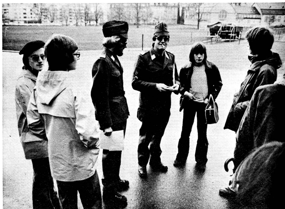
Sektion St. Gallen. Zwei Gruppen vor dem Start. Funkgeräte gefasst, Unterlagen studiert, Zwischenverpflegung gepackt, Zigarette angezündet...