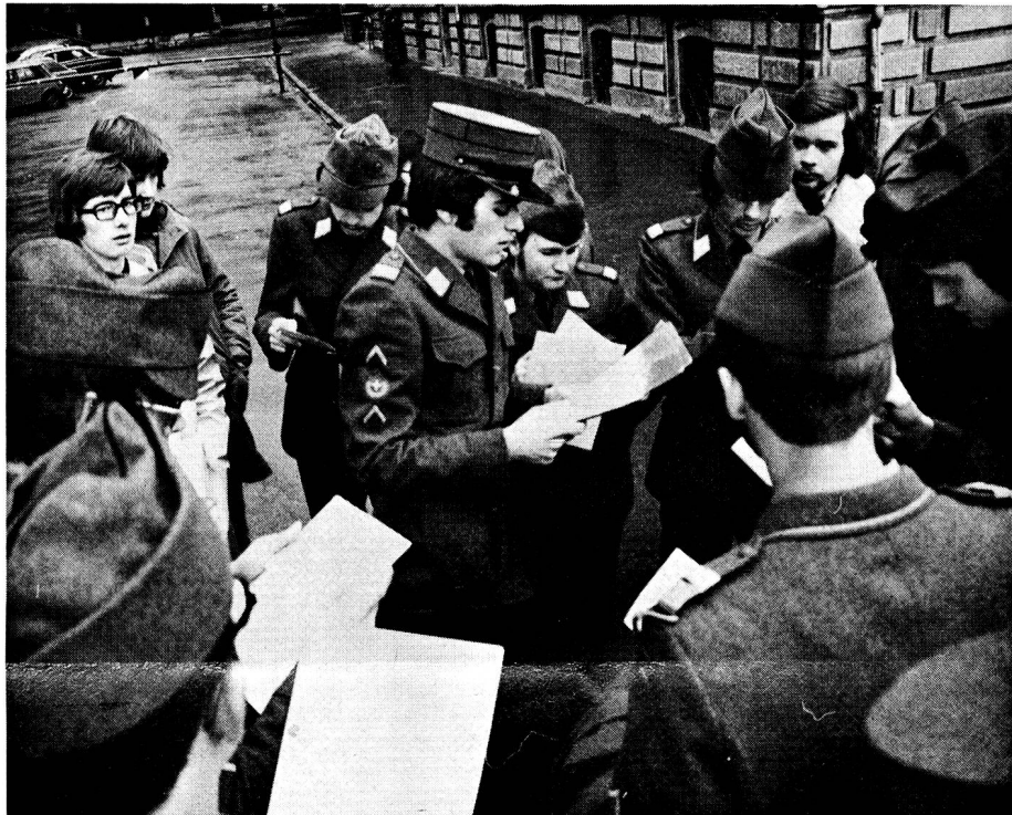
Sektion St. Gallen. Bei der Orientierung über die Uebermittlungsübung «Helvetia» studierten die Aktivmitglieder die Unterlagen sehr genau. Sie mussten später ihren Jungmitgliedern die Übung erklären und mit ihnen weitere Details besprechen.

9.30 Uhr war der Kanal für die Streckensicherung am Waffenlauf reserviert. Die Netzleitstation versuchte mit allen zehn