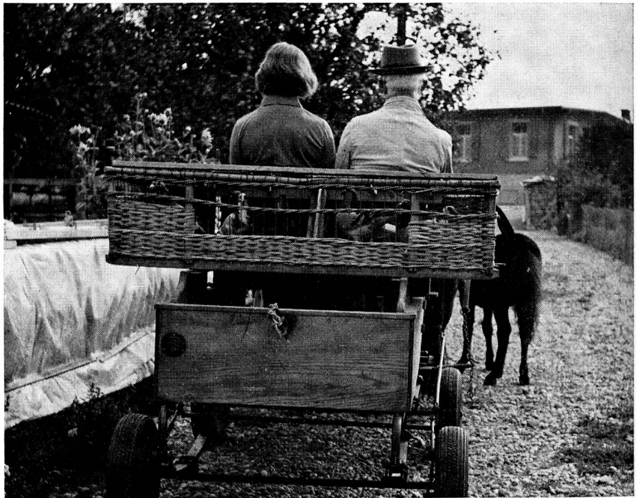
So werden die Tauben jeweils für einen Trainingsflug auf den Bahnhof gebracht

A part cette activité au profit de l'armée, les pigeons sont entraînés également à des performances intéressant le civil. Ils