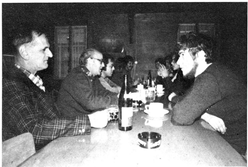
Der fachtechnische Kurs SE-412 der Sektion Uri-Altdorf endete mit der Uebungsbesprechung und einem Hock in kameradschaftlicher Atmosphäre