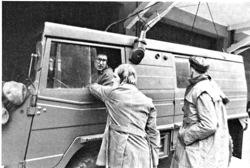
Ein letzter Tip des Präsidenten der Sektion Uri-Altdorf an den Stationsführer der SE-412