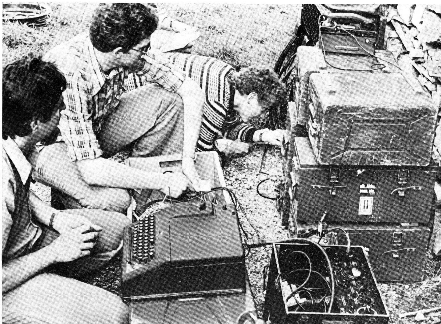
Fachtechnischer Kurs R-902 der Sektion Zürcher Oberland/Uster: Selbst auf den Knien lässt sich ein Gerät wie die R-902 installieren!

Mit Geduld kam die Verbindung schliesslich doch noch rechtzeitig zustande.