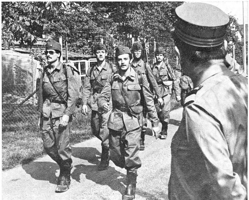
Einmarsch in Hunzenschwil (Tagesziel)

Mittwoch, 25. August 1976. Wir wurden um Mitternacht geweckt. Um 02.00 Uhr war Abmarsch. Die Strecke betrug 60 km und führte von Hunzenschwil über Suhr - Kölliken - Safenwil - Aarburg - Murgenthal - Aarwangen bis nach Koppigen. Diese Etappe war die längste des Marsches überhaupt und die Freude, am Etappenziel angelangt zu sein, war eine doppelte. Erstens hatte man schon mehr als 100 km zurückgelegt und gleichzeitig auch die Hälfte der Offiziersschule absolviert. Das Kader der Schule liess sich etwas Besonderes einfallen und stiftete zu diesem An-