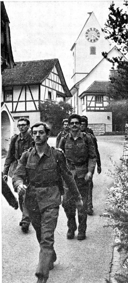
06.20 Uhr Durchmarsch in Buchs ZH