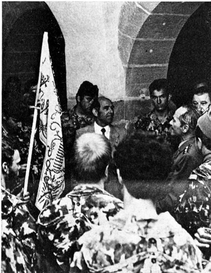
Apéro bei der Stadtbehörde von Murten

von Murten vertrat. Danach richteten der Waffenchef der Uebermittlungstruppen und unser Schulkommandant einige Worte an die zahlreich erschienenen Gäste, Eltern und Angehörigen der Aspiranten. Zur Verschönerung der Feier trug auch das Spiel des Infanterie-Regiments 8 bei. Jedem Aspiranten wurden zur freudigen Uebererraschung eine Anerkennungsurkunde und eine Gedenkmedaille überreicht. Unser Waffenchef und unser Schulkommandant gratulierten dazu jedem mit einem persönlichen Handschlag. Am Ende der Feier stiegen Hunderte von Brieftauben in die Lüfte und brachten die frohe Botschaft in alle Landesgegenden.