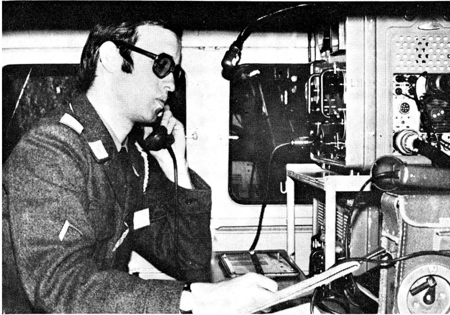
Oben: Alle wichtigen Verbindungen wurden mit SE-222-Kurzwellenfunkstationen zusätzlich gesichert. Unser Bild zeigt eine Station des Zentrums Worb im Einsatz.