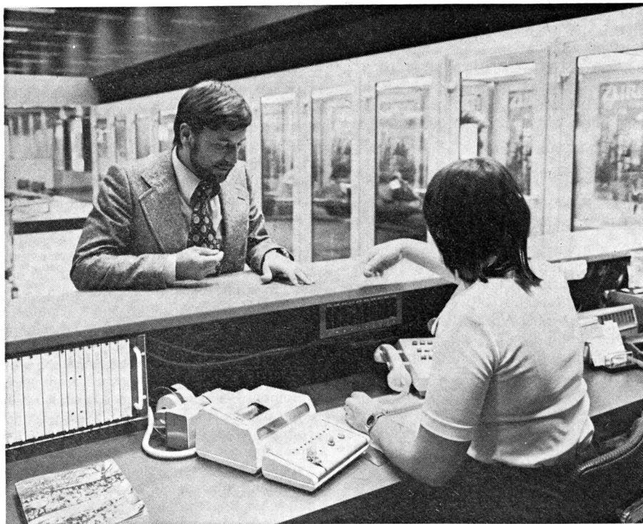
MULTIPRINT im öffentlichen Telefonbüro des Flughafens Zürich-Kloten

SODECO-SAIA SA, ein Unternehmen der Landis & Gyr-Gruppe, hat kürzlich das Gerät MULTIPRINT auf den Markt gebracht. Dieses ist für die Verbesserung und Vereinfachung der Ueberwachung und der