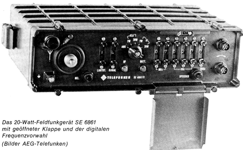
Das 20-Watt-Feldfunkgerät SE 6861 mit geöffneter Klappe und der digitalen Frequenzvorwahl

durch entfallen alle mechanischen Abstimmittel und wesentliche Störquellen. Durch den eingebauten Speicher ist die Bedienung des Feldfunkgerätes so einfach wie die eines UKW-Gerätes. Vier beliebige Frequenzen im Bereich von 1,5 bis 30 MHz