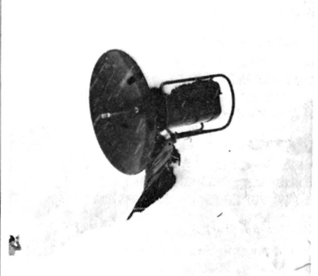
«Neue 79» cosr. B. Schürch

Con un giustificato orgoglio Erwin ci ha