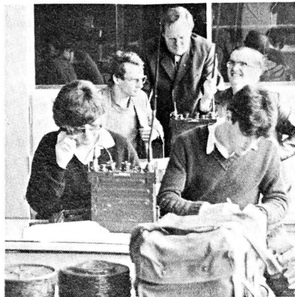
Die Kursteilnehmer sind in das Studium der Funkstation SE-227 vertieft

Als Abschluss der Funkerkurse 1978 und 1979 gab die Sektion zusammen mit den Verantwortlichen der Funkerkurse Heerbrugg, den Kursteilnehmern sowie den Jungmitgliedern Gelegenheit, die zukünftigen «Arbeitsplätze» zu besichtigen. Neben der Möglichkeit, diejenigen Funkmittel zu beschnuppern, an denen auf dem Waffenplatz Bülach ausgebildet wird, konnten noch einige Veteranen begutachtet werden, die seit kürzerer oder längerer Zeit nicht mehr als Uebermittlungsmittel eingesetzt werden. Als anschliessend unter der kundigen Führung von Adj Uof R. Bosshard noch die Amateurfunkstation HB 4 FF besichtigt werden konnte, war