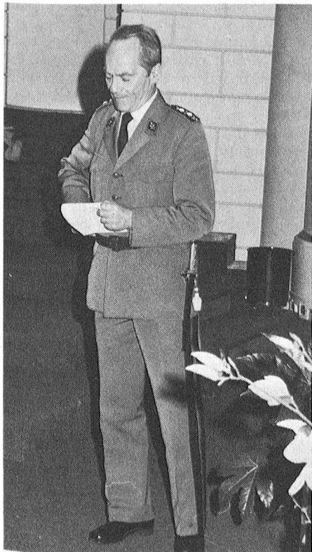
Der Waffenchef der Übermittlungstruppen, Divisionär A. Guisolan, während seiner Rede fundamentalen Bedeutung anlässlich der 52. ordentlichen Delegiertenversammlung des EVU in Luzern. Divisionär A. Guisolan wurde durch die Delegiertenversammlung zum jüngsten Ehrenmitglied des Verbandes ernannt.

Das gleiche Verhalten, das Ihr Präsident verurteilt, ist auch in diesem Bereich zu treffen. Wenn Hans der Nutzniesser einer Dispensa-