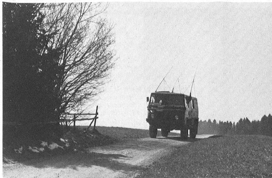
Il n'y a que le président pour avoir une idée pareille

Les mois se suivent et le chroniqueur a toujours autant de peine à concocter un article pour les lecteurs de la section. Il faut dire qu'on ne lui communique pas beaucoup de nouvelles susceptibles d'être publiées. Mais, c'est bien connu, les rédacteurs sont condamnés à se creuser le petit pois pour ne pas décevoir les membres qu'on ne voit pas beaucoup, pour ne pas dire jamais!