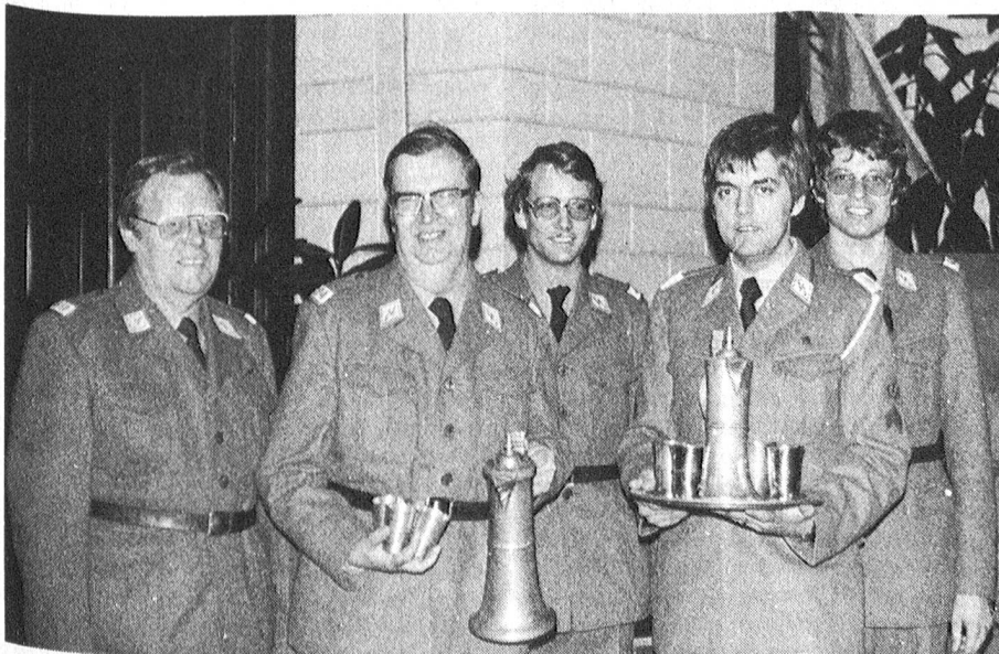
Beide Wanderpreise wurden an der diesjährigen DV in Luzern der Sektion Mittelrheintal verliehen. – Unser Bild zeigt die Vertreter der Sektion mit ihren Auszeichnungen.

An der diesjährigen DV in Luzern war die Sektion aus dem St. Galler Rheintal recht gut vertreten. Fünf Mitglieder, teilweise von ihrer «beseren Hälfte» begleitet, reisten zu diesem ge-