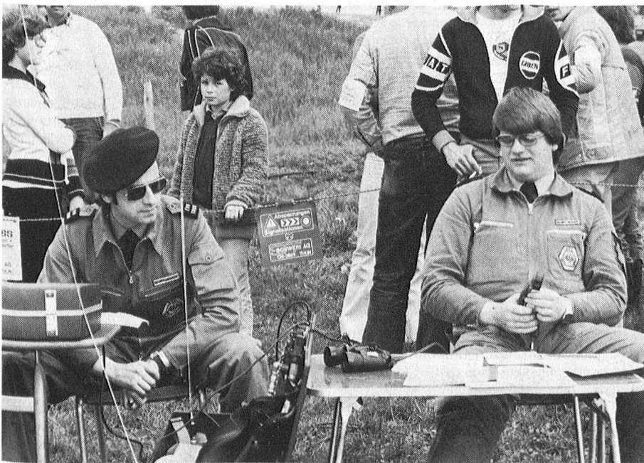
Sektion Thun: «Die Verbindungen haben die Probe bestanden.»

Rund 600 Franken an Mitgliedbeiträgen stehen leider noch aus. Ein Veteranenmitglied sowie 15 Aktiv- und 8 Jungmitglieder versäumten bis zum Redaktionsschluss, ihren Obulus zu entrichten. Du gehörst doch wohl nicht dazu, Ka-