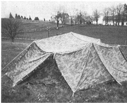
Mit diesem aus Blachen zusammengesetzten Armeezelt schützte eine Stationsmannschaft die Übermittlungsgeräte vor den unerwünschten Regengüssen.

nahm der Pontonierverein das Angebot an, und die darauf erfolgten Abklärungen ergaben, dass die Drahtverbindungen zwischen dem Festzelt und dem «Zentrum» benötigt werden, nämlich zwei für Telefone und eine für Lautsprecher. Somit verlegte man am Vorabend des Fest- und Wettkampfbeginnes die drei F-2-Drahtverbindungen über eine Distanz von etwa 700 Meter dank der Erfahrung, welche man beim Bau an der IMARO (Internationale Modellbahnausstellung, Rorschach) erworben hatte, innert kürzester Zeit.