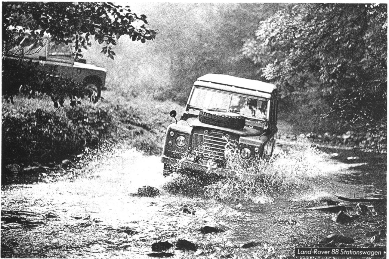
Land-Rover 88 Stationswagen