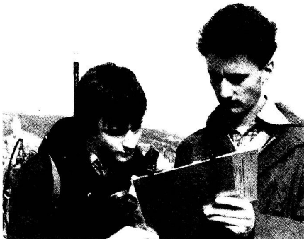
Mit gutem Erfolg veranstaltet die Sektion Thurgau alljährlich «Schnupper-Funkübungen» für Morseschüler: solche Übungen stossen auf Interesse, weil sie Abwechslung in die vordienstliche Morseausbildung bringen.

Weiter machte der JM-Chef des ZV die Erfahrung, dass Anmeldetalons sich auf die Beteiligungsquoten negativ auswirken: Man schiebt eine aktive Anmeldung auf, bis plötzlich der Termin verstrichen ist. Dies hindert einen erst recht, noch kurzfristig sich anzuhängen und mitzumachen. Ausweg: Der Übungsleiter sichert sich mit einer gezielten Telefonaktion bei potentiellen Kandidaten die minimale Teilnehmerzahl für die Durchführung des Anlasses. Die Jugendlichen hingegen kommen aus «Wissenshunger» so oder so an einen Kurs oder eine Übung; ihr Interesse erlahmt nur dann, wenn sie durch schlechte Übungsanlagen enttäuscht und demotiviert werden. ●