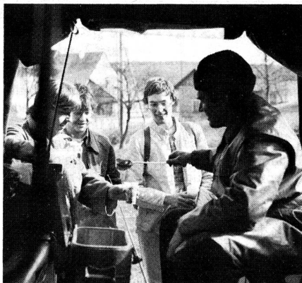
Ein Teeposten unterwegs