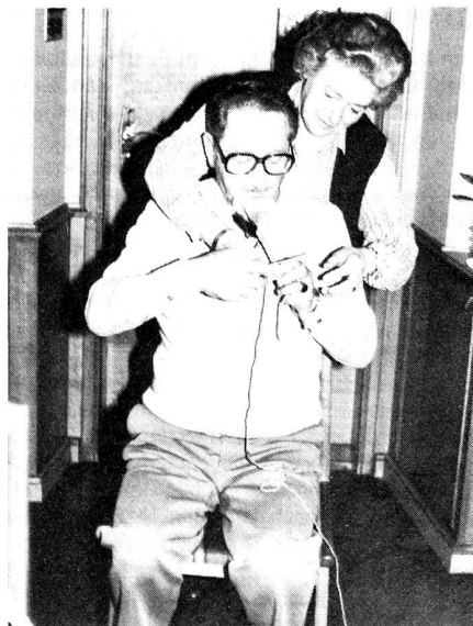
Am FAMAB 80 der Sektion Mittelrheintal unterstützten hilfreiche Gattinnen ihre Männer beim Lösen der Strickaufgabe.

Edi Hutter begrüßte die Gäste, welche von nah und fern hierhergekommen waren. Auch eine Delegation aus dem Thurgau zählte dazu. Die Veteranen wussten manch interessante Begebenheit aus der Gründungszeit zu berichten. Die Sektion erlebte seit ihrem Bestehen einige Hochs und Tiefs.