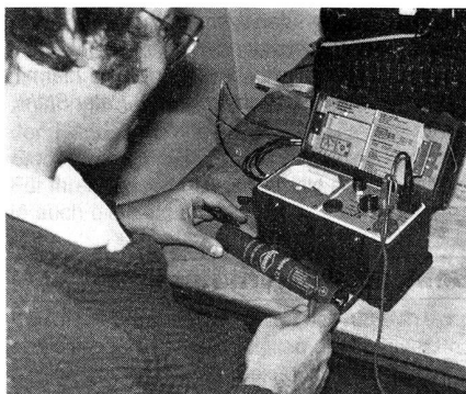
Sektion Bern: Am fachtechnischen Kurs «Draht» machte das Messgerät T-02 einen bedeutend besseren Eindruck als das bisherige «Feldmesskästchen». Jeder Teilnehmer führte vorbereitete Spannungs-, Isolations- und Widerstandsmessungen durch.

damit heimlich gefeierte Geburtstage nachträglich abgegolten? Mag es sein wie es ist, allen Spendern ein herzliches «Bravo»! Leider vergehen die schönen Stunden nur allzu schnell; um die letzte Fahrgelegenheit nicht zu verpassen, musste rechtzeitig ans Heimgehen gedacht werden. In der Hoffnung, noch manches Jahr mit den liebgewonnenen Kameraden solche Hocke organisieren zu können, möchte ich auch unsere Verbundenheit mit denjenigen bekunden, welche an der Teilnahme verhindert waren. Gaston